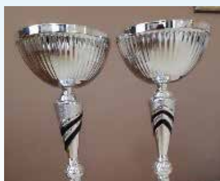
uspjesi školskog sportskog kluba