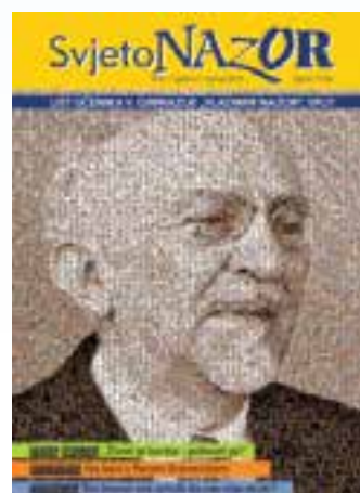
jedna od naslovnica školskog lista