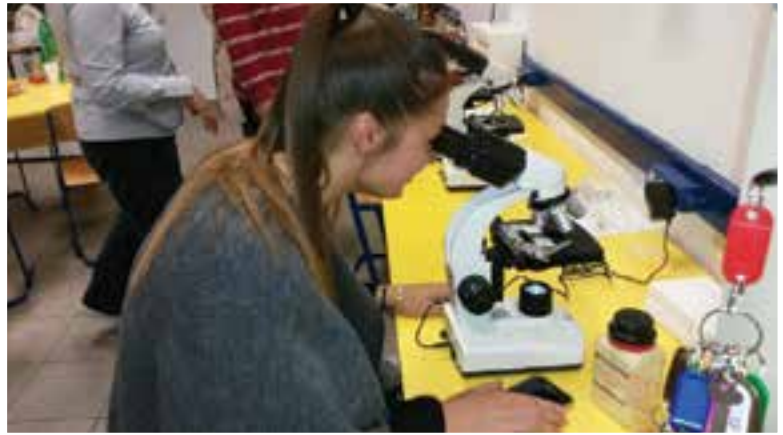
Moderne kompetencije za modernu gimnaziju

uče proces javne politike na način da i sami postaju dio tog procesa u cilju izgradnje informiranog, sposobnog i odgovornog građanina i usvajanja vrijednosti zajedničkog dobra svih građana.