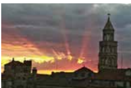
pogled s naših prozora

Pitaju nas... preživi li se Peta? Ne preživi se - proživi se!