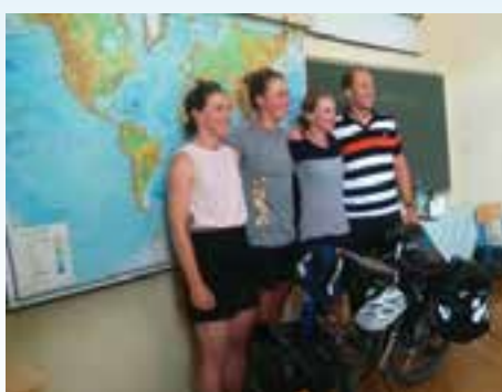
promičemo zdravi način življenja (olimpijke u gostima)