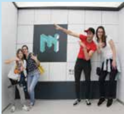
terenska nastava u Hrvatskoj i inozemstvu