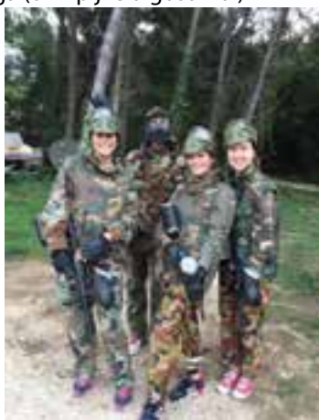
nagrada razredu s najmanjim brojem izostanaka